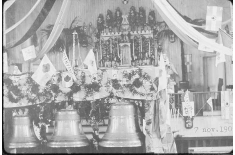
Photo prise lors de la bénédiction des cloches de la première église de Lac-au-Saumon, le 7 novembre 1907