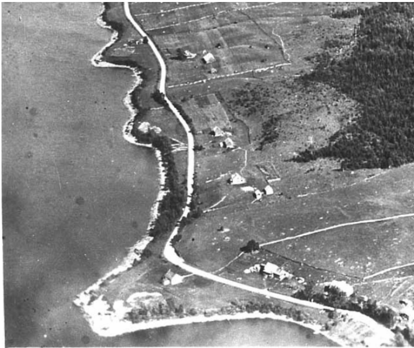
La pointe de l'école et le chemin Matapédiac. Lac-au-Saumon, 1927

La raison principale en est bien entendu une de mise en marché, mais également d'homologation du produit par une instance certifiée dont les coûts sont à priori exorbitants. Reste à voir si un tel service pourrait être offert à prix abordable dans la région. (M.T.)