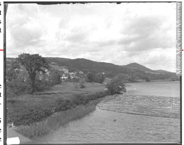
MUSÉE MCCORD MUSEUM

n'empêche d'innover avec, entre autres, des bâtiments verts comme cela a été proposé la semaine dernière par un groupe de citoyens en voie de s'organiser.